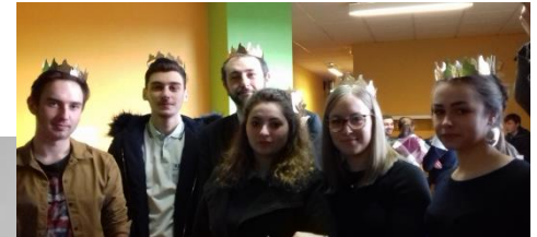
Galette des rois