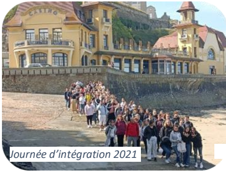
Journée d'intégration 2021

L'établissement d'enseignement supérieur de St Thomas d'Aquin est aussi un lieu de vie au quotidien ou à travers des activités plus ponctuelles.