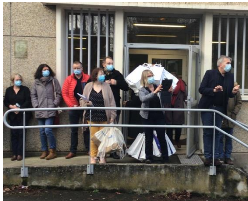
Semaine Création Entreprises 2021