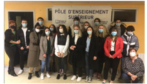
L'accueil des terminales janv 2021