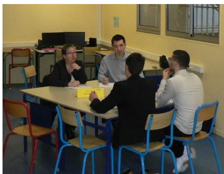
Rencontre avec des professionnels