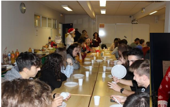
Journée Noël 2019